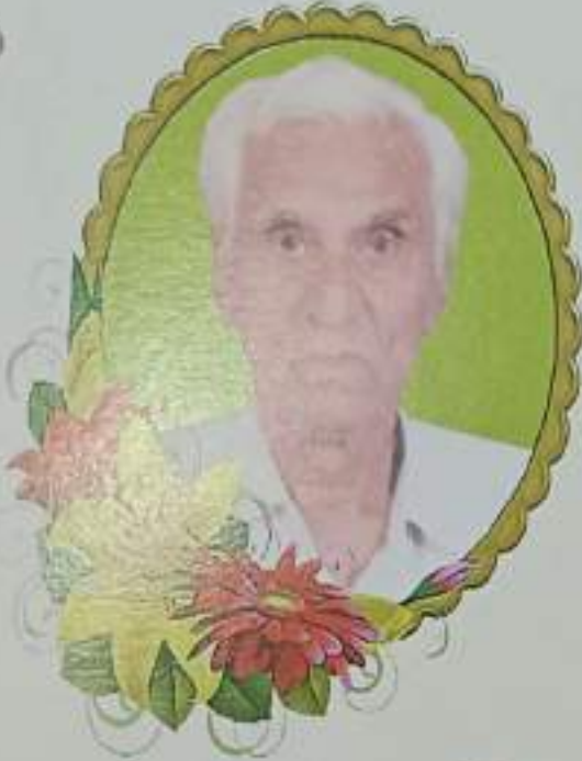
स्व. श्री. व्ही.एस. वानखेडे बॅंकेचे माजी उपाध्यक्ष